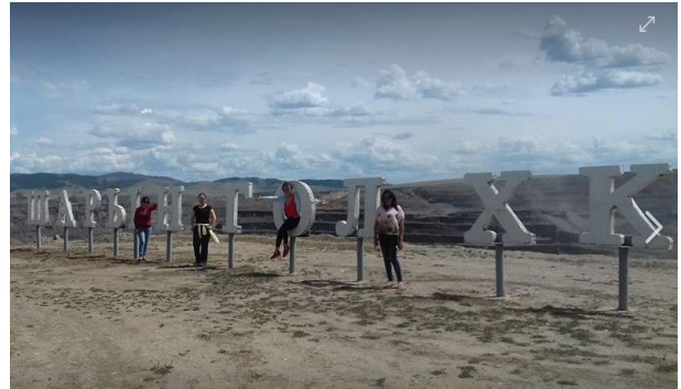
Шарын гол сум