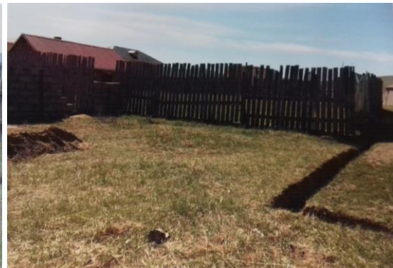
13-р баг, Их сургуулийн 6-1 тоотын зүүн талд Сүхбаатарын 2м сунгасан модон хашааг буулгасан /2017.05.12/